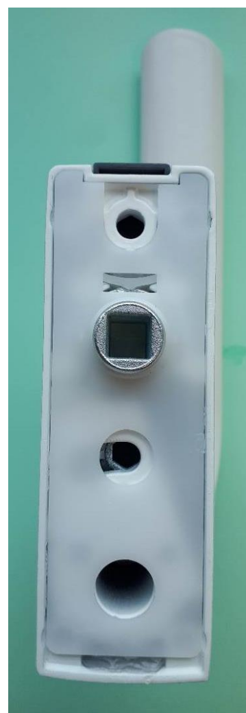
Put the plastic cover back on