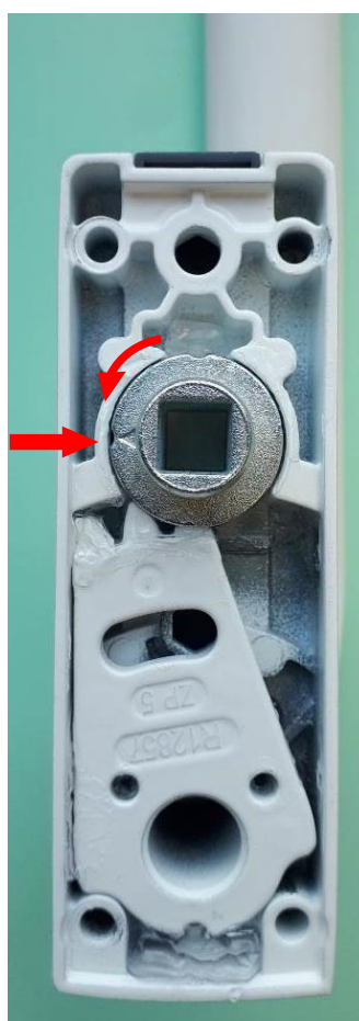
Lift the pinion and turn it 1/4 turn to the left as shown