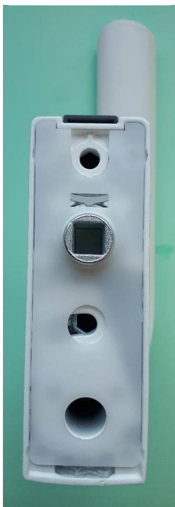
Handle in closed position